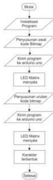
Gambar 3 Flowchart kerja Arduino uno