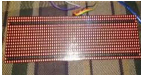
Gambar 2. Hasil modifikasi kode bitmap

Selanjutnya pembuatan program Arduino uno, program ini sebagai awal pembuatan mapping bitmap. Proses awal yaitu melakukan uji coba kode bitmap bawaan. Kemudian dilanjutkan proses uji coba penggantian kode bitmap baru yang telah dimodifikasi. Hasilnya LED DOT MATRIX F3.75 mati beberapa baris, terlihat pada Gambar 2.