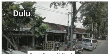
Pasar Bunga Kalisari