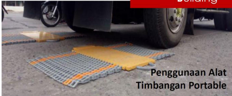
Penggunaan Alat Timbangan Portable