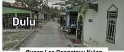
Bugen Lor, Bangetayu Kulon