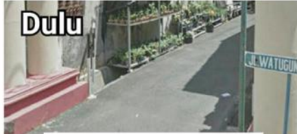
Jalan Watugunung IV, Krapyak