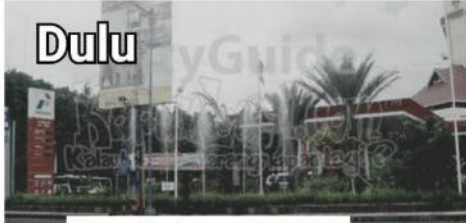
Taman Pandanaran, Dulu SPBU