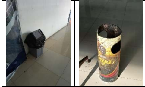
Gambar 13. Ketersediaan Tempat Sampah pada Terminal Terpadu Merak