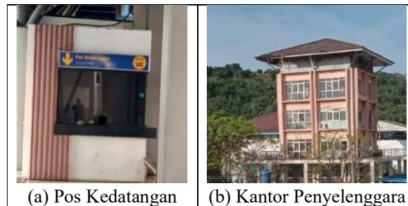
(a) Pos Kedatangan

Berdasarkan hasil observasi, dijumpai terdapat kerusakan pada atap kantor penyelenggara terminal dan rembesan pada dinding. Berikut dokumentasi pusat kendali di Terminal Terpadu Merak disajikan pada Gambar 8.