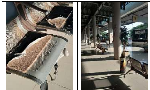
Gambar 14. Ketersediaan ruang tunggu pada Terminal Terpadu Merak

Berdasarkan hasil observasi, pada ruang tunggu terdapat kursi duduk yang dapat menampung 28 orang. Dari keseluruhan jumlah tersebut, kondisi kursi sudah berkarat dan busa duduknya sobek. Ruang tunggu bagi penumpang di Terminal Terpadu Merak merupakan ruang tunggu di ruangan terbuka sehingga tidak menggunakan kipas angin maupun air conditioner . Kondisi ruang tunggu dapat dilihat pada Gambar 14 yang disajikan berikut.