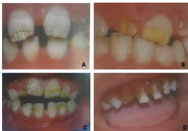
Gambar 2. (A) pitting hypoplastic defects on enamel, (B) enamel defect in an eruption dentition, (C) hypoplastic defects of enamel, (D) high caries risk 1