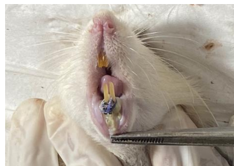
Gambar 3. Gambaran klinis rongga mulut tikus wistar setelah 72 jam pemasangan braket stainless steel pada kelompok perlakuan.

Hasil penelitian ini menunjukkan adanya gambaran klinis stomatitis mukosa rongga mulut tikus wistar (Gambar 3) pada 72 jam pasca pemasangan braket yang direndam pada minuman berkarbonasi, hal ini sesuai dengan teori reaksi hipersensitivitas tipe IV yang dapat muncul pada 24-72 jam pasca adanya kontak kulit/mukosa dengan antigen atau alergen dan memicu reaksi inflamasi. Penelitian Faisal, dkk (2018) menunjukkan bahwa pada fase inflamasi akan terjadi peningkatan jumlah neutrofil yang dimulai dari 1 jam pertama dan meningkat pada 72 jam. 2,19 Inflamasi berperan sebagai respon imun tubuh terhadap kerusakan jaringan dengan melepaskan mediator inflamasi. 20