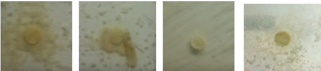
Gambar 2. Hasil pengukuran daya hambat yoghurt plain konsentrasi 25%, 50%, 75% dan 100%