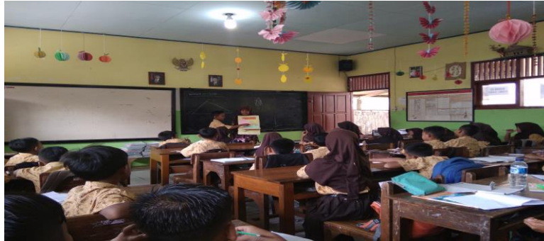
Gambar 2. Guru menjelaskan dengan media Pop Up

peserta didik agar bisa mendefinisikan tugas yang diberikan, guru mendorong peserta didik agar mendapat kejelasan yang diperlukan. Dalam mengembangkan dan menyajikan hasil karya siswa, guru berperan penting dalam mengarahkan siswa agar mampu menyajikan karyanya kedalam bentuk laporan. Diakhir pembelajaran, guru melakukan refleksi serta evaluasi terhadap proses belajar mengajar yang telah dilakukan.