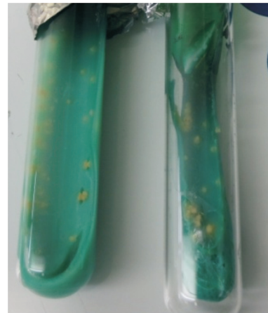
Gambar 2. Positif kultur NTM ( Non Tuberculous Mycobacteria ) tipe slow-growing nonphotochromogen.