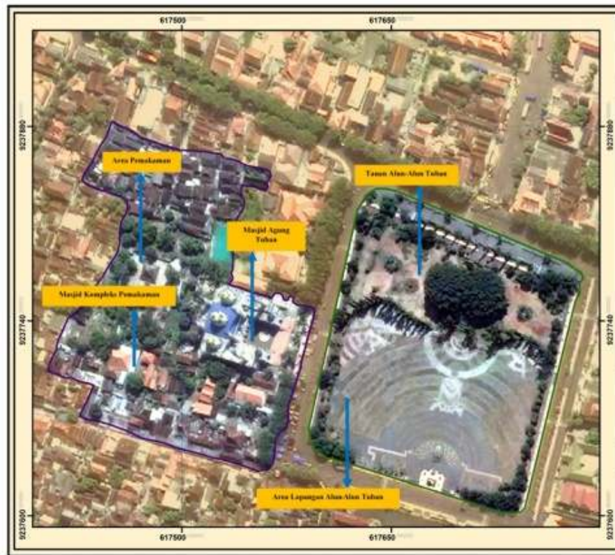
Gambar 1 Peta Lokasi Penelitian

H 1 : Terdapat pengaruh antara aktivitas kawasan ziarah terhadap ruang terbuka publik alun-alun kota Tuban