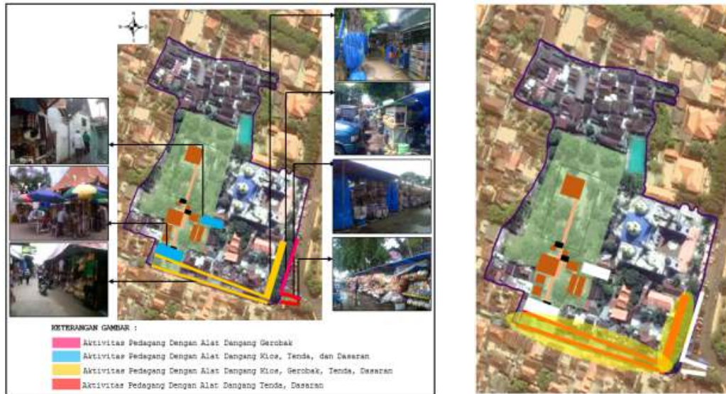
Gambar 4 Hasil Overlay Kondisi Aktivitas Perdagangan dan Jasa di Kompleks Pemakaman Sunan Bonang