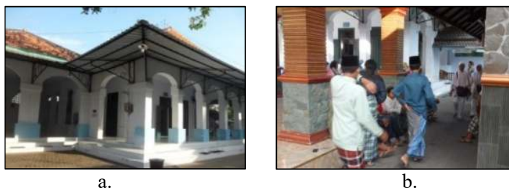
Gambar 2 Aktivitas Beribadah dan Mengaji di Kompleks Pemakaman Sunan Bonang

Selain aktivitas utama spiritual, di kompleks pemakaman Sunan Bonang juga terdapat aktivitas utama historis, yaitu aktivitas yang terkait dengan ziarah makam. Sebagai salah satu kegiatan ziarah untuk memperingati wafatnya Sunan Bonang, pihak pengelola makam mengadakan acara tahunan yaitu haul Sunan Bonang. Haul sunan bonang biasanya dilaksanakan pada saat bulan Syuro, pada hari Kamis Pon/Jum'at Wage yang melibatkan ratusan ribu orang baik dari dalam maupun luar kota Tuban. Aktivitas historis di pemakaman Sunan Bonang banyak di minati oleh pengunjung baik dari dalam maupun luar wilayah Kota Tuban, seperti pada saat Haul banyak jamaah yang hadir dan melibatkan ratusan ribu jama'ah. Aktivitas Ziarah makam di lakukan pada cungkup utama yang terletak pada bagian 3 pola pemanfaatan ruang kompleks pemakaman Sunan Bonang.