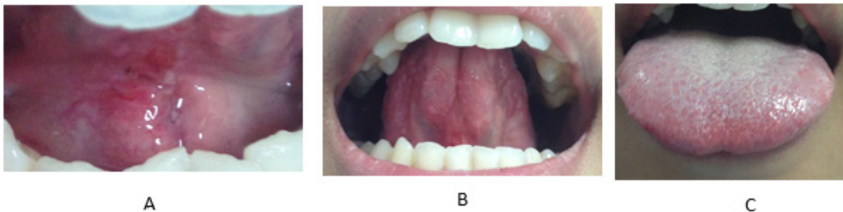
Gambar 2. Kontrol 1 minggu : A. lidah mengangkat tampak lingual. B. lidah mengangkat ke palatum. C. lidah menjulur tampak depan

Sehari setelah dilakukan tindakan pembedahan pasien mengeluhkan adanya pembengkakan pada bagian bawah rahang (submandibula) dan sembuh setelah dua hari. Pada kontrol 1 minggu pasien menyatakan sudah tidak terdapat keluhan dan hasil pemeriksaan klinis terdapat warna kemerahan pada daerah pembedahan. Pada saat kontrol 1 minggu dilakukan pembukaan jahitan pada pasien. Pada saat kontrol 1 bulan setelah dilakukan frenektomi lingual tidak terdapat keluhan serta tidak ada warna kemerahan pada daerah pembedahan. Pasien sudah dapat menggerakkan lidah ke palatum serta sudah dapat menggerakkan lidah ke bagian labial kiri dan kanan. Operator menginstruksikan pasien melakukan beberapa latihan seperti menjulurkan lidah ke arah hidung, kemudian