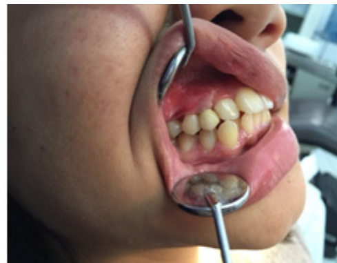
Gambar 6. Insersi Mahkota #13