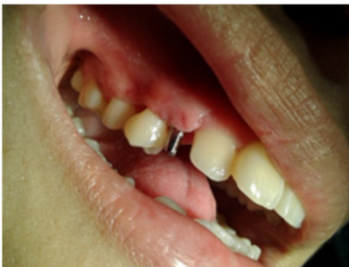
Gambar 5. Satu minggu setelah insersi implan