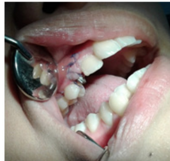
Gambar 4. Insersi One-piece dental implant