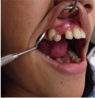
Gambar 1. Kondisi Intraoral

gigi insisif kedua kanan rahang atas #12 dan premolar pertama kanan rahang atas #14. Pada pemeriksaan intraoral, terdapat edentulous ridge antara gigi #12 dan #14 dengan lebar ruang edentulous 5 mm. Gigi caninus kanan rahang atas #13 erupsi pada bagian bukal antara gigi #14 dan #15. Kesehatan umum pasien baik dan tidak ada riwayat medis. Pada pemeriksaan radiografi panoramik didapat gambaran akar gigi #13 yang bengkok dan gigi #38, #48 yang tidak erupsi sempurna. Pemeriksaan jaringan lunak, tekstur, konsistensi dan ketebalan gingiva tidak terdapat kelainan, dengan pola oklusi Klas I Angle.