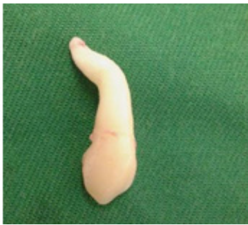
Gambar 3. Gigi #13 yang sudah diekstraksi

dilakukan persiapan abutmen dan pembuatan mahkota sementara dari akrilik. Pencetakan gigi dilakukan dengan menggunakan bahan elastomer. Pada hari ke-30 setelah proses pemasangan implan, tampak penyembuhan jaringan lunak. Mahkota sementara dilepas dan dilakukan persiapan abutmen untuk pembuatan mahkota tetap. Pasien dicetak kembali dengan bahan cetak berbasis silikon (polisiloksan). Mahkota tetap yang dipilih adalah mahkota tetap berbahan porcelain fuse to metal. Mahkota tetap diinsersi dengan menggunakan glass ionomer cement