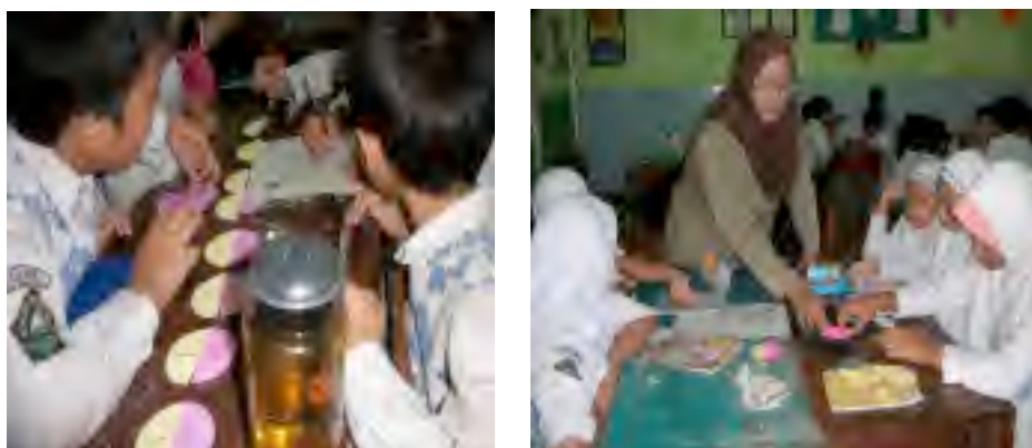
Gambar 5. Pembelajaran pada Kelas Eksperimen ( E_2 )

Dokumentasi kegiatan siswa dalam pembelajaran kelompok eksperimen ( E_2 ).