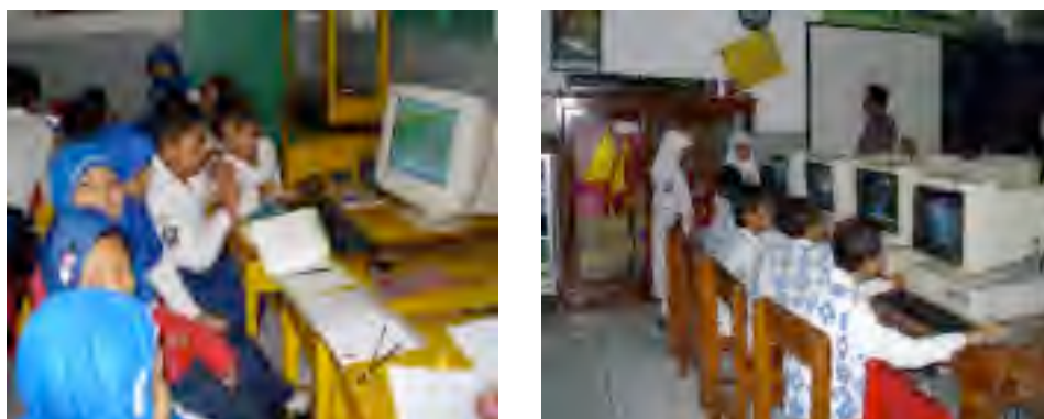
Gambar 4. Pembelajaran pada Kelas Eksperimen ( E_1 )

Dokumentasi kegiatan siswa dalam pembelajaran kelompok eksperimen ( E_1 ).