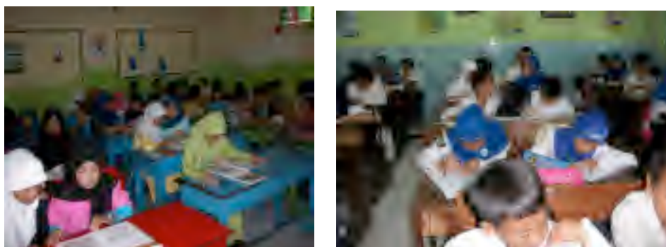
Gambar 6. Pembelajaran Ekspositori pada Kelas Kontrol

Dokumentasi kegiatan siswa dalam pembelajaran pada kelompok kontrol.