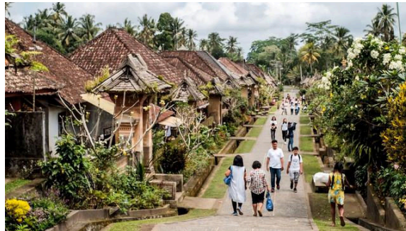
Gambar 1. Desa Wisata Panglipuran

Menurut Admin, (2020) Desa Digital, Desa Wisata merupakan komunitas atau masyarakat yang terdiri dari para penduduk di suatu wilayah terbatas yang saling berinteraksi secara langsung dibawah sebuah pengelolaan dan memiliki kepedulian dan kesadaran untuk berkoordinasi membangun dan dibentuk untuk memberdayakan masyarakat sebagai pelaku utama dalam penyelenggaraan Desa Wisata. Fungsi Desa Wisata yaitu sebagai wadah bagi masyarakat dalam mewujudkan kepedulian dan memaksimalkan potensi wilayah yang ada sebagai tempat wisata.