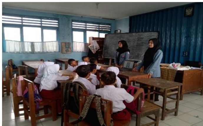
Gambar 3. Ujicoba produk